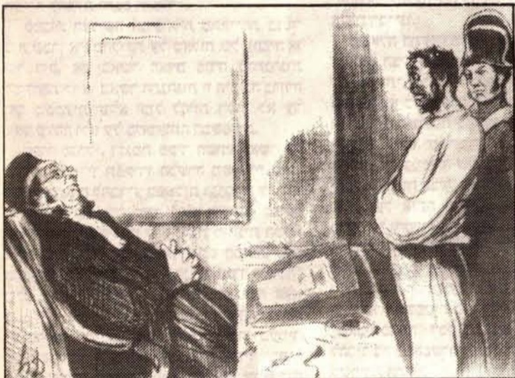
ציור מס' 3