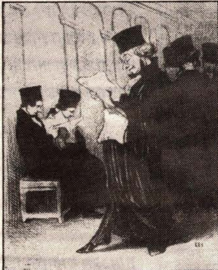
ציור מס' 6

בתקופה שבין 1827 ו-1841 כותב ויקטור הוגו את הגירסה הראשונה לעלובי החיים ודומייה מצייר את השופט במשפטו של ז'אן ול'אן: השופט מרושן ומרווח בכסאו, אומר לנאשם הנדחף קדימה על-ידי השוטר: "היית רעב, היית רעב, זו לא הצדקה ...אני רעב כמעט כל יום ובכל זאת אינני הולך לגנוב"