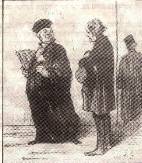
ציור מס' 5