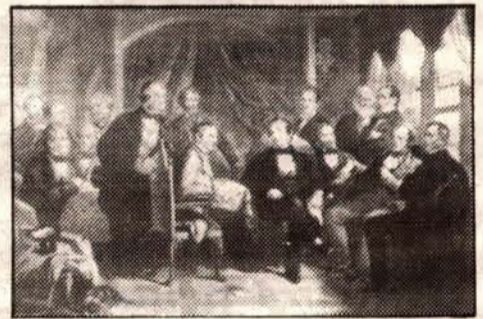
ציור מס' 1